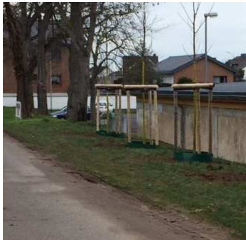
Für die gefälltten Bäume an der Außenhalle wurden durch die Stadt neue gepflanzt.